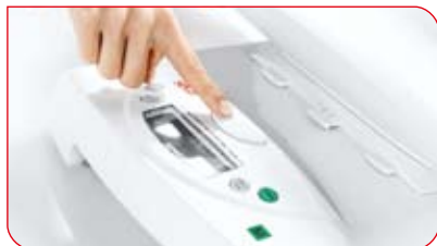
Szalka odłącza się od podstawy za jednym naciśnięciem przycisku.