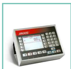
Miernik ME-12 systemu komputerowe