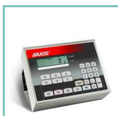
Miernik ME-11 z klawiaturą cyfrową