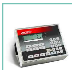
Miernik ME-02 do dozowania