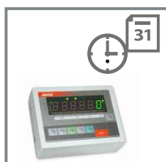
Miernik ME-01 z zegarem wewn.