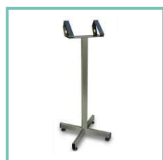
Statyw do miernika