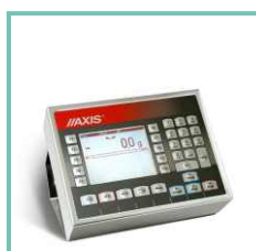
Miernik ME-03 do drukowania etykiet