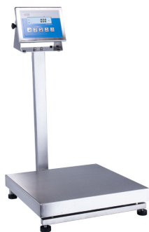
Waga platformowa wodoodporna H315.150.H3.M

Użyte rysunki, zdjęcia, grafiki mają charakter poglądowy.