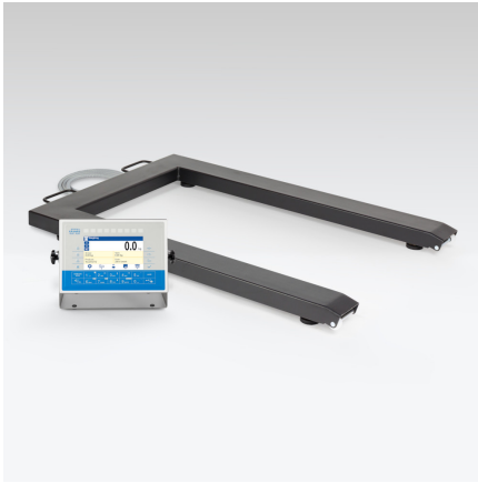
Wielofunkcyjna waga paletowa HX7.4P.1500.C

Użyte rysunki, zdjęcia, grafiki mają charakter poglądowy.